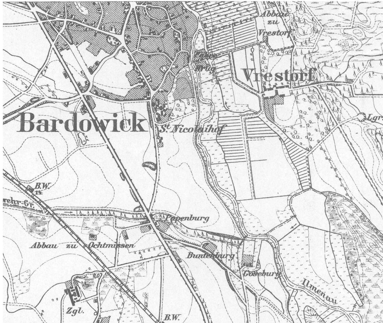
Abb. 6: Vergrößerter Ausschnitt aus der preussischen Landesaufnahme (1879)