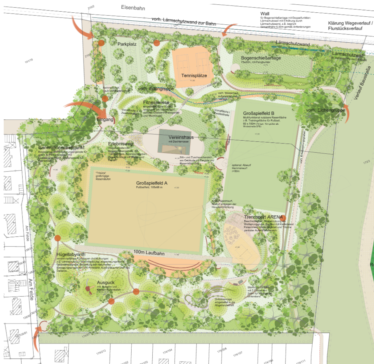
Abb. 4: Ausschnitt aus dem Raumkonzept für den Sportpark Radbruch (Planungsstand 2018, nicht verbindlich, es gelten die Festsetzungen des B-Plans), ohne Maßstab