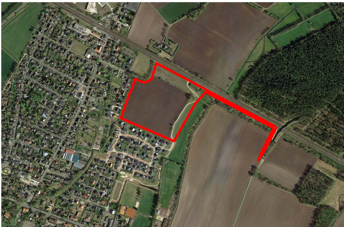
Abb. 1: Luftbild mit Lage des Plangebiets, ohne Maßstab

Die Flächen werden derzeit landwirtschaftlich genutzt. Im Norden grenzt die Bahnstrecke Hamburg Lüneburg an, im Osten grenzen weitere landwirtschaftlich genutzte Flächen an das Plangebiet. Südlich und westlich grenzen Wohngebiete an.