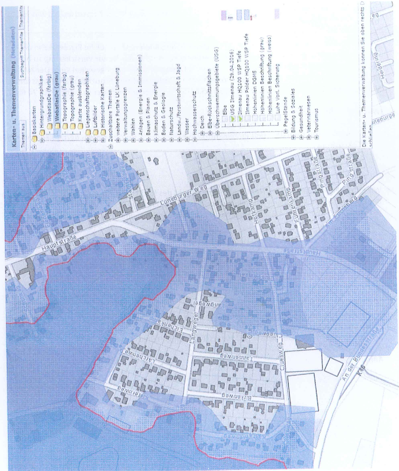
Abbildung 1:

Spendenkonten: Volksbank Lüneburger Heide, IBAN DE66 2406 0300 8507 7771 00 Sparkasse Lüneburg, IBAN DE92 2405 0110 0000 0117 34