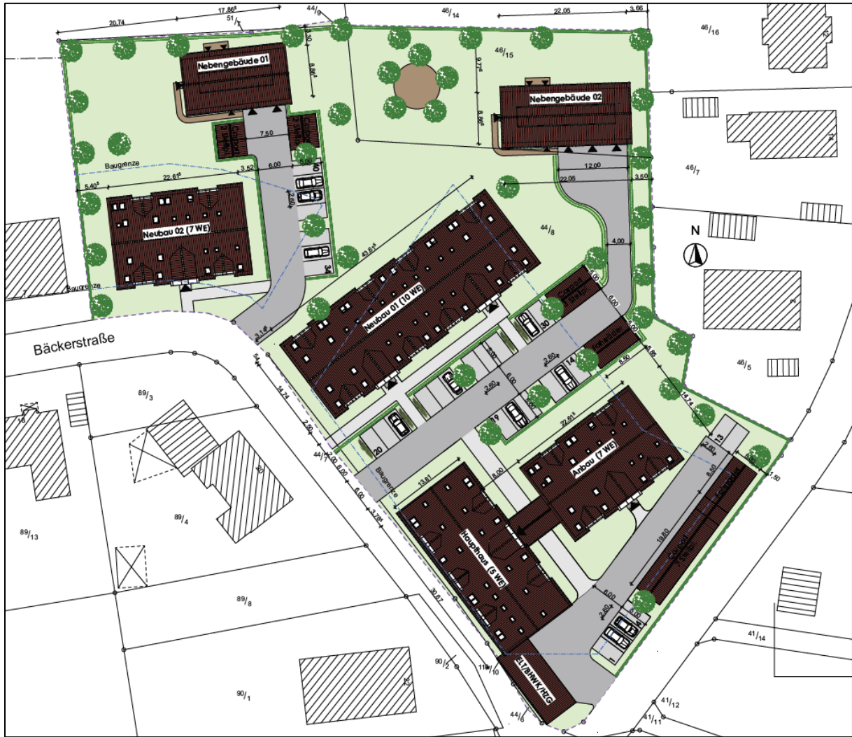
Abbildung 2: Entwurf Lageplan, Quelle: Architektur & Sachverständigen GmbH Jörg Hilmer