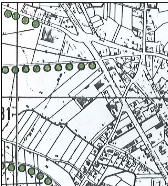
Abbildung 3: Landschaftsplan, Quelle: Flecken Bardowick

Die Landschaftsplanung soll die Ziele des Naturschutzes und der Landschaftspflege konkretisieren und die Erfordernisse und Maßnahmen zur Verwirklichung dieser Ziele aufzeigen. Die überörtlichen Ziele, Erfordernisse und Maßnahmen werden für den Bereich des Landes im Landschaftsprogramm, für Teile des Landes in den Landschaftsrahmenplänen dargestellt. Auf regionaler Ebene konkretisiert der Landschaftsplan die Vorgaben des Landschaftsprogrammes und des Landschaftsrahmenplanes. Die Ziele der Landschaftsplanung sind in der Abwägung im Rahmen der Bauleitplanung zu berücksichtigen.