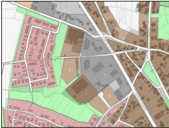
Abbildung 2: Flächennutzungsplan, Quelle: Samtgemeinde Bardowick

Der derzeit wirksame Flächennutzungsplan der Samtgemeinde Bardowick enthält für die Fläche des Plangebietes die Darstellung einer gemischten Baufläche (M) sowie einer Grünfläche. Um das Vorhaben der 2. Änderung des Bebauungsplanes gemäß § 8 Abs. 2 BauGB aus dem Flächennutzungsplan zu entwickeln, ist im Rahmen des Bauleitplanverfahrens gemäß § 13a BauGB eine Berichtigung des Flächennutzungsplanes erforderlich.